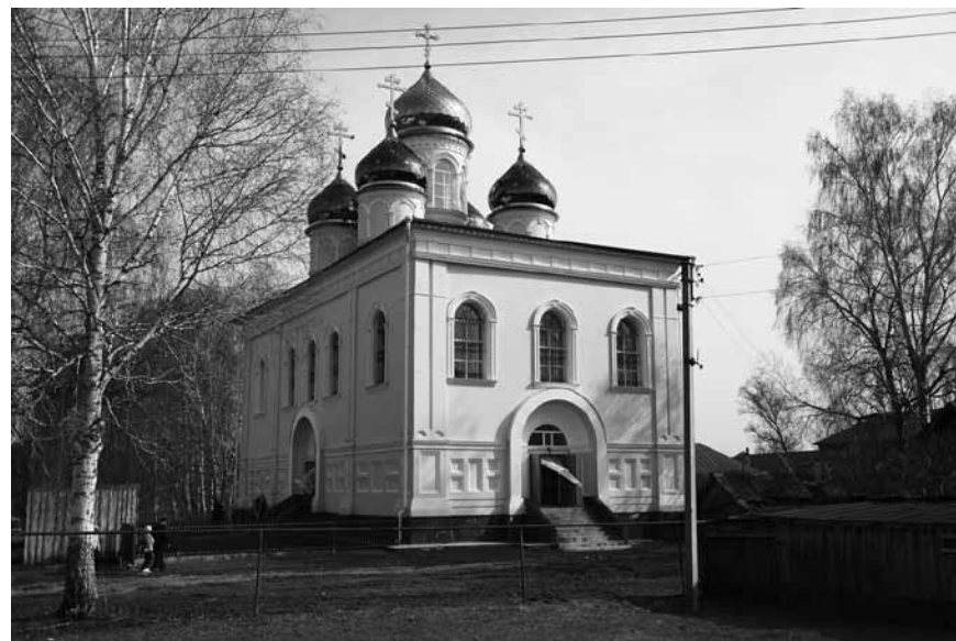
Большевьясский Владимирско-Богородицкий храм

Наталья СИЗОВА, фото Сергея Красильникова