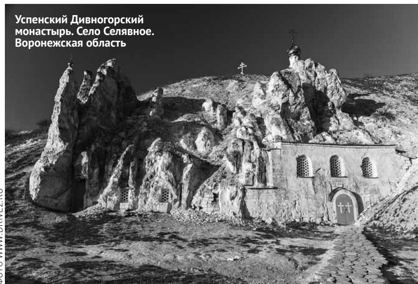
Успенский Дивногорский монастырь. Село Селявное. Воронежская область

Во время лагерной смены совершались маршброски на стрельбище, где проходила стрельба по ми-