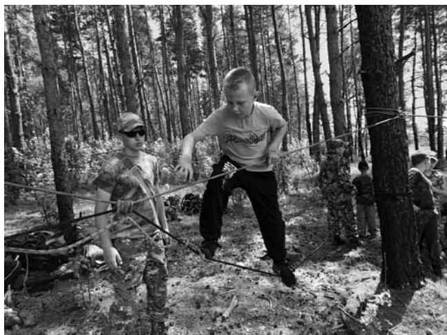
Занятие для будущих мужчин

Православный мальчик – это воин, защитник, созидатель и творец, который знает свою культуру, понимает, для чего он живет, и много чего умеет. Умеет бороться со страхом, умеет побеждать самого себя, умеет чувствовать свое тело, не обращать внимания на боль.