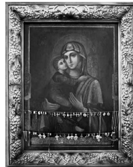
Чудотворная Владимирская икона Божией Матери

После революции 1917 года практически все обители Пензенской губернии были закрыты, но во Вьясе монашеская жизнь теплилась до 1925 года. После чего монастырь начали планомерно стирать с лица земли. Иконы и богослужебные книги сжигали прямо у святых стен. Чудотворный Владимирский образ Богородицы бесследно