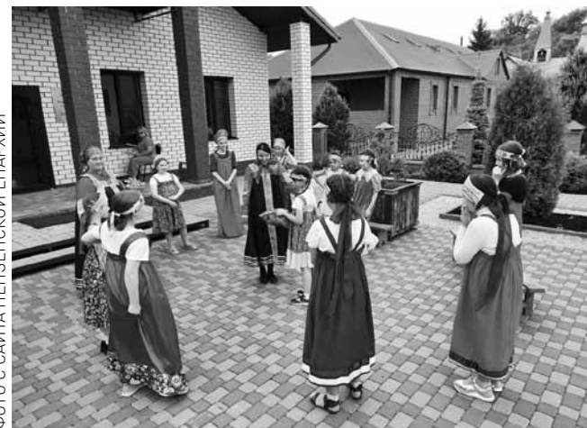
Девочки водили хороводы, как встарь